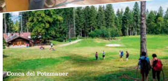
Conca del Potzmaier

domenica 18 luglio Grumes di Altavalle - Potzmaier 13.30