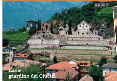
Lavis, giardino dei Ciucioi